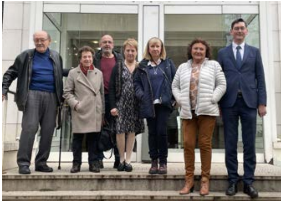
Vos nouveaux représentants des locataires et le Directeur Général de l'OPH Rives de Seine Habitat