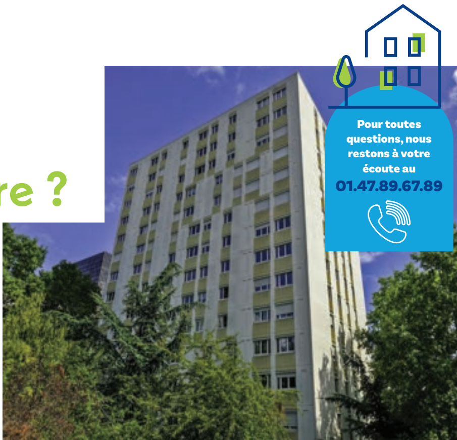
Résidence Louis Pouey - Agence de Puteaux

Afin de favoriser l'accès social à la propriété, l'OPH Rives de Seine Habitat met en vente, à Puteaux, 10 logements au sein de la résidence Louis Pouey. Pour de nombreuses familles, ce dispositif peut être une réelle opportunité de devenir propriétaire de sa résidence à un prix abordable et avec un mode d'accès sécurisé.